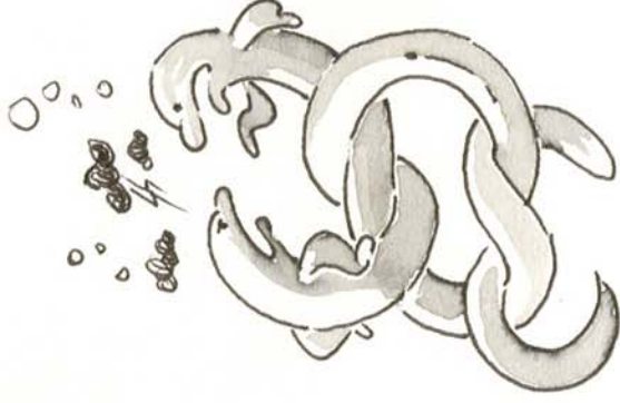
Palingen die in de knoop zitten,!..