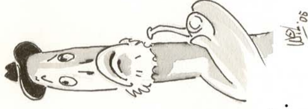
En palingen met hoed.